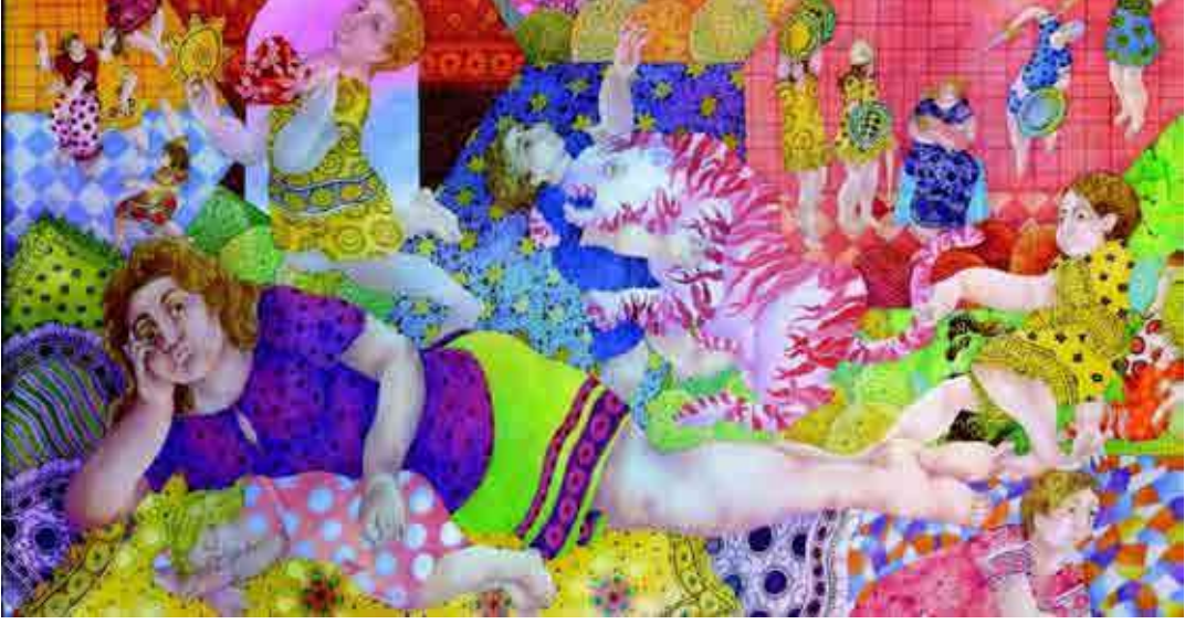
Burman, Shakti, 2020, Untitled, Oilpaint on canvas