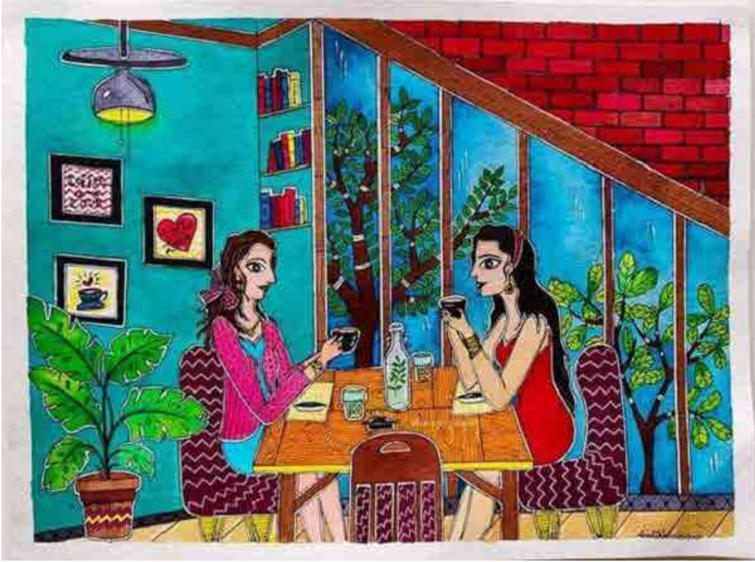
Acharya, Dhruvi, 2020, Untitled, Oilpaint on canvas.

स्टुडिओमध्ये जाऊन काम करणंही शक्य नव्हतं त्यांना, त्यावेळी घरात सापडतील त्या पाठकोऱ्या कागदांवर त्यांनी आपली चित्र काढणं सुरु ठेवलं.