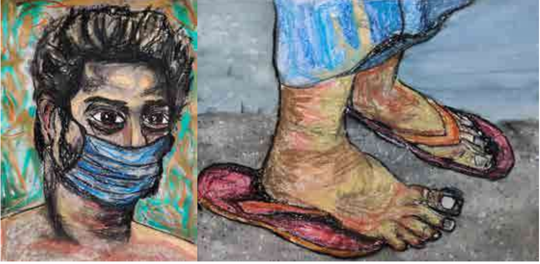
Pande, Charudatt, 2020, Untitled 1, Acrylic