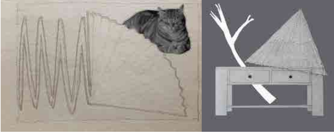
Deshmukh, Yashawant, 2020, Untitled, Digital Drawing