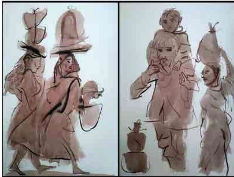
Das, Jatin, 2020, Migrant, Ink on Paper

** (लेखाकरता चित्रकार, चित्र-व्यावसायिकांसोबत झालेला प्रत्यक्ष संवाद, मुलाखती तसेच विविध वृत्तमाध्यमातील वृत्तांतांची बहुमोल मदत झाली. त्या सर्वांचे मनापासून आभार.)