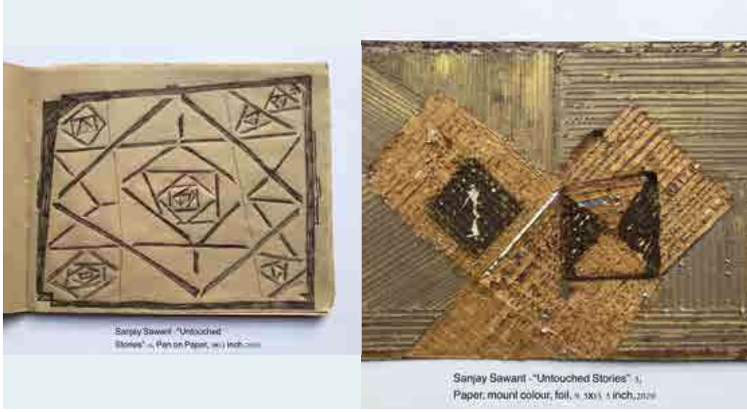
Sawant, Sanjay, 2020, Untouched Stories-4, Pen on paper, 9 in X 12 in