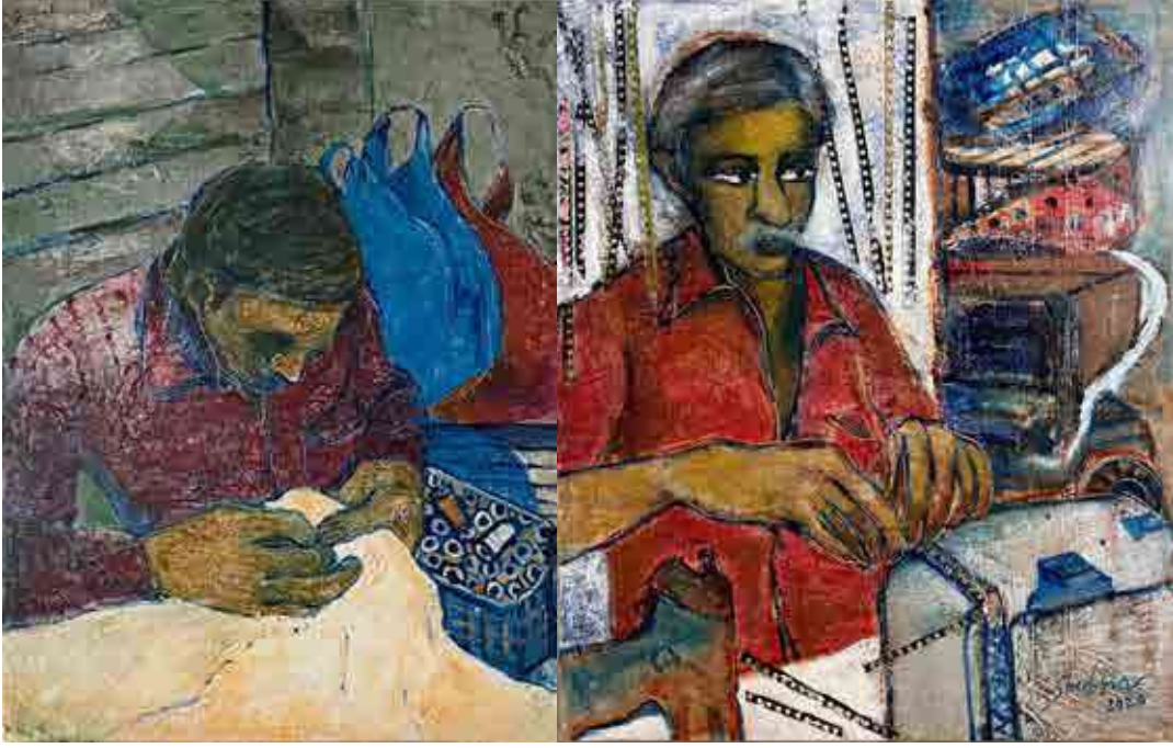
Gokhale, Shubha, 2020, Untitled, 2, Oilpaint on Canvas