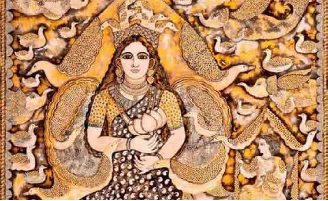
Burman, Jayashree, 2020, Untitled, Oilpaint on canvas

पुढील काळात अधिक जोमाने होईल ही आशा मनाशी बाळगणं गरजेचं आहे. कला माणसाला प्रतिकूल परिस्थितीतून बाहेर यायला निश्चित मदत करते.