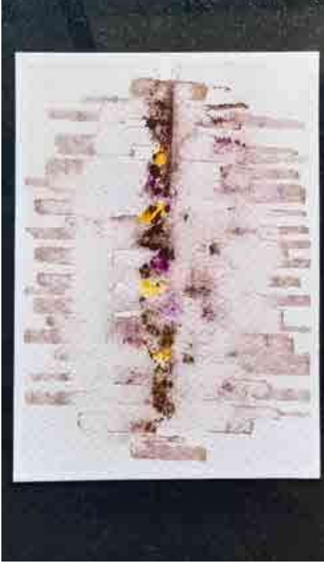
Waghmare, Prakash, 2020, Untitled, 1, Oilpaint on Canvas