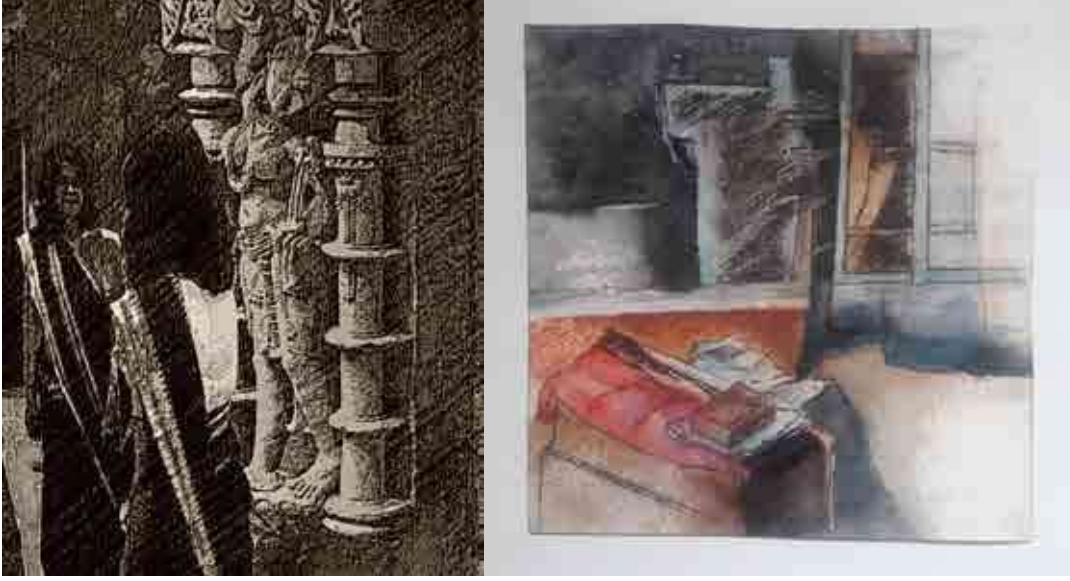
Apte, Vishakha, 2020, Untitled, Digital print on paper