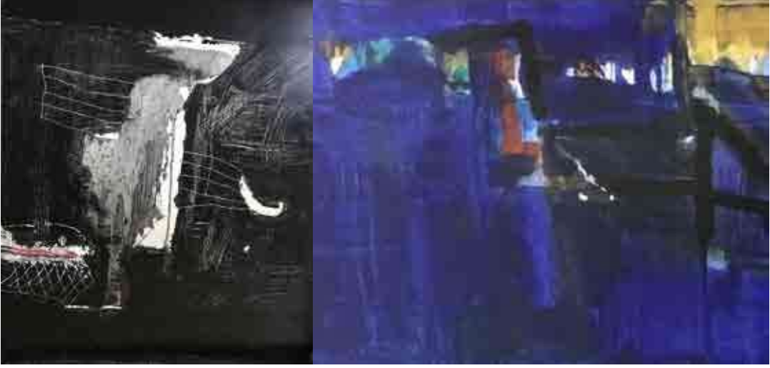
Kolte, Prabhakar, 2020, Untitled, 1, Oilpaint on Canvas