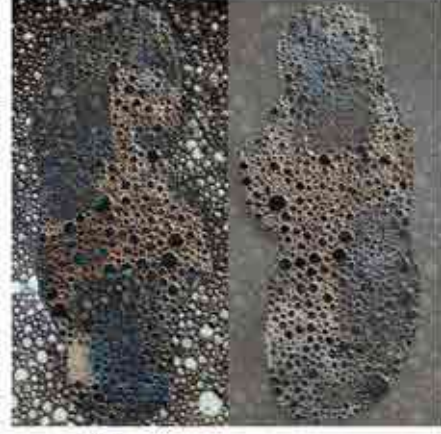
Sweety Joshi "Never ending Migration" Still image from video art, 2020

Joshi, Sweety, 2020, Can you hear the voice of starvation, Still Image from Video Art