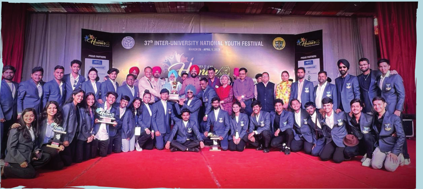
३७ व्या आंतर विद्यापीठीय राष्ट्रीय युवा महोत्सवामध्ये मुंबई विद्यापीठाची विजयी चमू

हा राष्ट्रीय महोत्सव दोन फेऱ्यांमध्ये आयोजित केला जातो. स्पर्धेची प्राथमिक फेरी संपूर्ण देशात पाच क्षेत्रीय (पूर्व, पश्चिम, उत्तर, दक्षिण आणि मध्य) विभागात