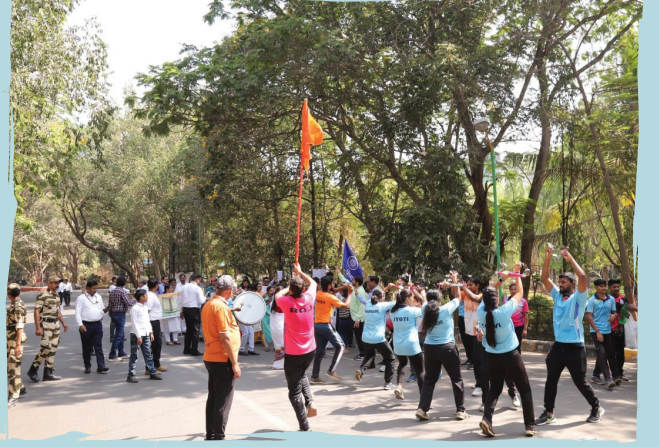
संविधान गौरव यात्रेसाठी काढण्यात आलेले लेझिम पथक