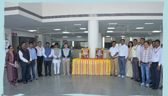
क्रांतीसूर्य जोतिराव फुले आणि भारतरत्न डॉ. बाबासाहेब आंबेडकर जयंती निमित्त आयोजित पुस्तके आणि दुर्मिळ ग्रंथ साहित्यांचे प्रदर्शनाची क्षणचित्रे