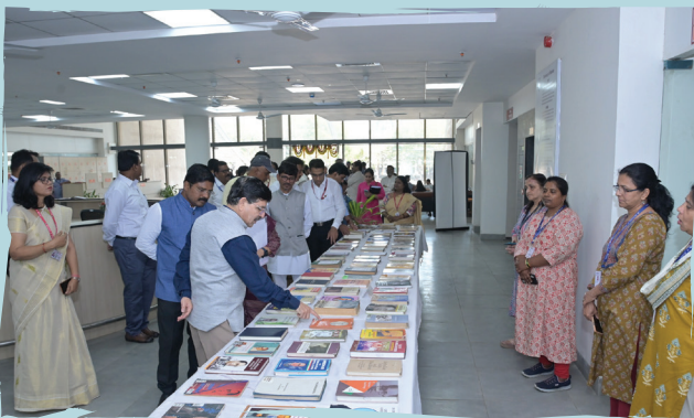
क्रांतीसूर्य जोतिराव फुले आणि भारतरत्न डॉ. बाबासाहेब आंबेडकर जयंती निमित्त आयोजित पुस्तके आणि दुर्मिळ ग्रंथ साहित्यांचे प्रदर्शनाची क्षणचित्रे

मुंबई विद्यापीठामध्ये ८ एप्रिल ते १४ एप्रिल २०२४ या दरम्यान महात्मा ज्योतिबा फुले व भारतरत्न डॉ. बाबासाहेब आंबेडकर संयुक्त जयंती सप्ताहाचे आयोजन