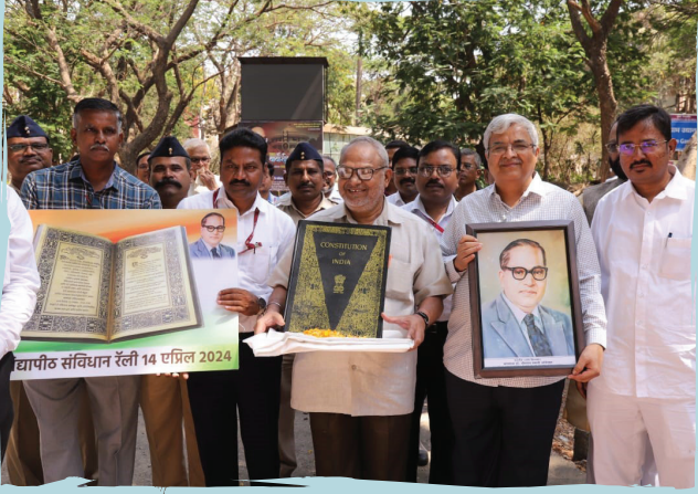
संविधान गौरव यात्रेत सहभागी झालेले मान्यवर