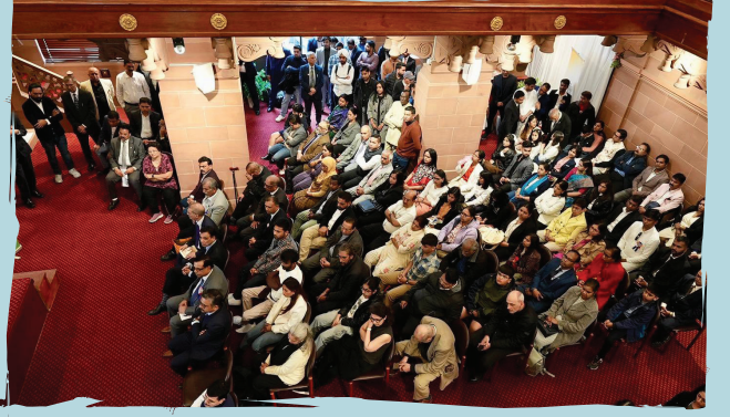
लंडन येथील भारतीय उच्चायुक्तातर्फे 'भारत भवन' येथे भारतरत्न डॉ. बाबासाहेब आंबेडकर यांच्या जयंतीनिमित्त आयोजित कार्यक्रमाची क्षणचित्रे