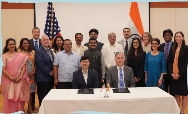
अमेरिकेतील प्रतिष्ठित सेंट लुईस विद्यापीठासोबत शैक्षणिक सामंजस्य कराराची क्षणचित्रे

मुंबई, दि. ०५ एप्रिल: राष्ट्रीय शैक्षणिक धोरणाच्या