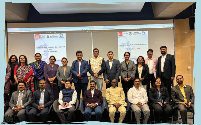
लंडन स्कूल ऑफ इकॉनॉमिक्स येथे आयोजित केलेल्या आंतरराष्ट्रीय परिषदेत सहभागी झालेले मान्यवर