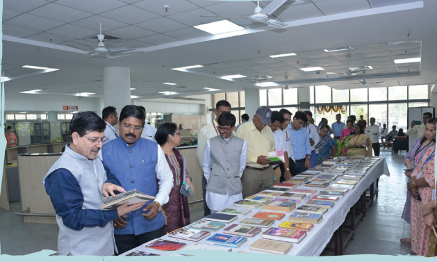
क्रांतीसूर्य जोतिराव फुले आणि भारतरत्न डॉ. बाबासाहेब आंबेडकर जयंती निमित्त आयोजित पुस्तके आणि दुर्मिळ ग्रंथ साहित्यांचे प्रदर्शनाची क्षणचित्रे

करण्यात आले आहे. या जयंती सप्ताहाच्या पहिल्या दिवशी महात्मा ज्योतिबा फुले व भारतरत्न डॉ. बाबासाहेब आंबेडकर यांनी व त्यांच्यावरील लिहलेल्या दुर्मिळ पुस्तक प्रदर्शनाचे आयोजन करण्यात आले आहे. या ग्रंथ