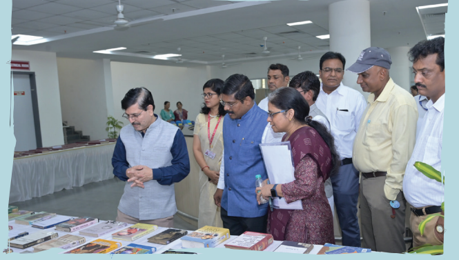
क्रांतीसूर्य जोतिराव फुले आणि भारतरत्न डॉ. बाबासाहेब आंबेडकर जयंती निमित्त आयोजित पुस्तके आणि दुर्मिळ ग्रंथ साहित्यांचे प्रदर्शनाची क्षणचित्रे