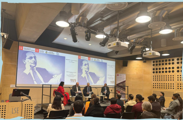
लंडन स्कूल ऑफ इकॉनॉमिक्स येथे आयोजित केलेल्या आंतरराष्ट्रीय परिषदेत सहभागी झालेले मान्यवर

दोन दिवस चाललेल्या या आंतरराष्ट्रीय परिषदेमध्ये 'आंबेडकर्स कॉन्ट्रीब्युशन्स टू इंडियन इकॉनॉमिक रिफॉर्म', 'कास्ट अँड सोशल जस्टीस', 'इंटरसेक्शनल इनइक्वॅलिटीज्', 'आंबेडकर्स व्हिजन ऑन एज्युकेशन, लिटरेचर अँड कल्चर' अशा चार सत्रात विविध संशोधकांनी त्यांच्या विषयांचे सादरीकरण केले. यामध्ये प्रामुख्याने 'डॉ. बी. आर. आंबेडकर नॉनकन्फर्मिस्ट इकॉनॉमिस्ट', 'द इकॉनॉमिक्स ऑफ कास्ट सिस्टीम', 'रेलेव्हंस ऑफ डॉ. बाबासाहेब आंबेडकर्स मॉडेल ऑफ नॅशनलायझेशन ऑफ एग्रीकल्चर लँड', 'द रोल ऑफ डॉ. बाबासाहेब आंबेडकर इन सस्टेनॅबल अँड इन्क्ल्युझिव्ह डेव्हलपमेंट ऑफ इंडिया', 'डॉ.बाबासाहेब आंबेडकर: आर्किटेक्ट ऑफ इंडियन कान्स्टीट्यूशन', 'रोल ऑफ डॉ. भीमराव आंबेडकर इन सस्टेनिंग सोशल जस्टीस इन इंडिया', 'अंडरस्टँडिंग आंबेडकर बीयॉण्ड रिझर्वेशन', 'फॉरगॉटन हिस्ट्रीज ऑफ रॅसिलाईज कलोनिअल नेटवर्क्स ऑफ डोमेस्टिक वर्कर्स इन साऊथ इंडिया', 'इंडियन वुमेन एट क्रॉसरोड्स', 'डॉ. बी. आर. आंबेडकर: अ