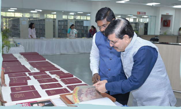
क्रांतीसूर्य जोतिराव फुले आणि भारतरत्न डॉ. बाबासाहेब आंबेडकर जयंती निमित्त आयोजित पुस्तके आणि दुर्मिळ ग्रंथ साहित्यांचे प्रदर्शनाची क्षणचित्रे